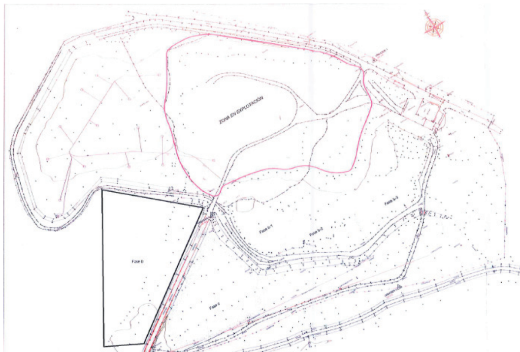
Figura 2. Plano 2 en planta de la instalación. Zona de vasos de vertido.